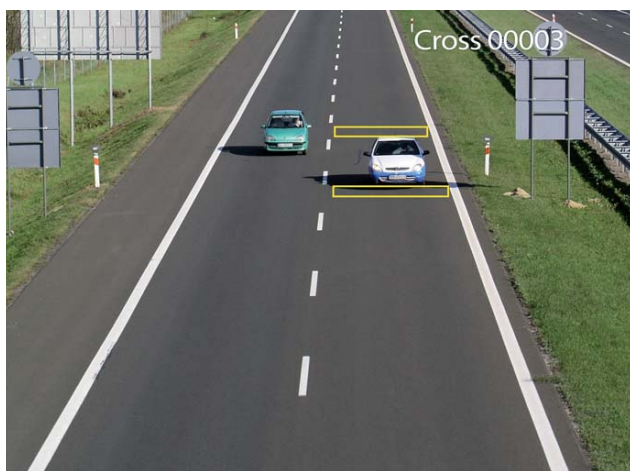
Fot. 3. Wykrywanie przekroczenia określonej strefy przez obiekt

wartości uprzednio zdefiniowanej w menu kamery pozwala na aktywację wyjścia alarmowego. Funkcję można wykorzystać m.in. do blokowania szlabanu na parkingu po przejechaniu określonej liczby pojazdów.