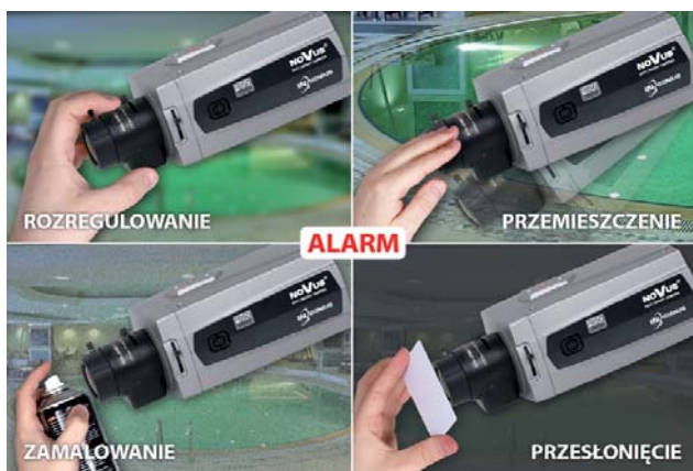
Fot. 4. Sabotaż kamery

Groźnym zjawiskiem w systemach monitoringu jest sabotaż kamery, czyli przesłonięcie lub zamałowanie obiektywu przez potencjalnych przestępców. Czyni to system całkowicie bezużytecznym na danym obszarze. Dlatego ważna jest natychmiastowa reakcja na tego typu zdarzenie. Kamery serii InGenius reagują na to poprzez aktywację wyjścia alarmowego. Dotyczy to również takich zdarzeń, jak nagła zmiana obserwowanej sceny, np. spowodowana obróceniem kamery lub utratą ostrości.