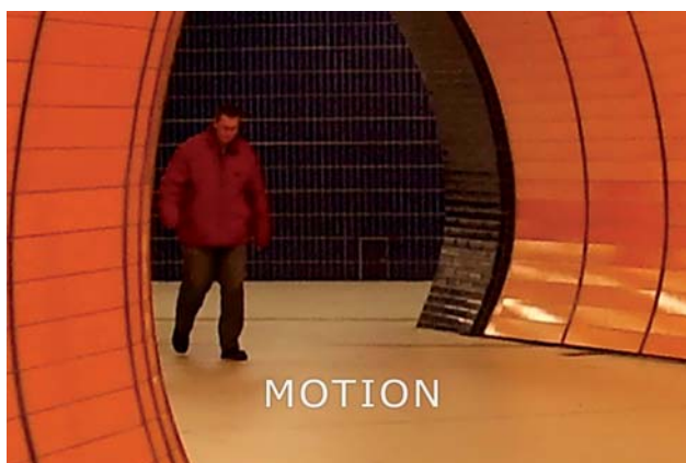
Fot. 2. Detekcja ruchu z funkcją zoomu cyfrowego

może być przydatna np. w monitoringu zautomatyzowanych linii produkcyjnych, gdzie tradycyjna detekcja ruchu jest bezużyteczna, a sytuacją nadzwyczajną – wymagającą szczególnego nadzoru ze strony operatora – jest pojawienie się człowieka. Innym zastosowaniem może być monitorowanie wjazdów do garaży w celu zapobieżenia wtargnięciu intruzów. Możliwe jest ustawienie poziomu czułości oraz minimalnego rozmiaru twarzy, przy którym następuje aktywacja wyjścia alarmowego.