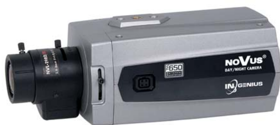
Fot. 1. Kamera serii InGenius

Kamery serii InGenius są klasycznymi kamerami dzień/noc z mechanicznym filtrem podczerwieni i wysoką czułością 0,04 lx/F = 1,2 w trybie monochromatycznym. W warunkach słabego oświetlenia mogą pracować również w trybie wydłużonej migawki (DSS). W trybie kolorowym generowany obraz ma rozdzielczość do 650 linii, natomiast w trybie monochromatycznym – do 700 linii telewizyjnych. Pracującą w trybie dzień/noc kamerą można sterować zewnętrznie, za pomocą wyprowadzonych zacisków na panelu tylnym. Ponadto kamera możeysterować sprzężone z nią promienniki podczerwieni. Kamery InGenius posiadają rozbudowane menu ekranowe, dostępne dzięki przyciskom na panelu tylnym lub zdalnie (standard RS485) – z wykorzystaniem protokołów Novus-C1 oraz Pelco-D i P. Ta druga możliwość jest szczególnie wartościowa dla instalatorów systemów ze względu na złożoność wielu funkcji i ewentualnie ze względu na konieczność korekty ustawień w trakcie eksploatacji.